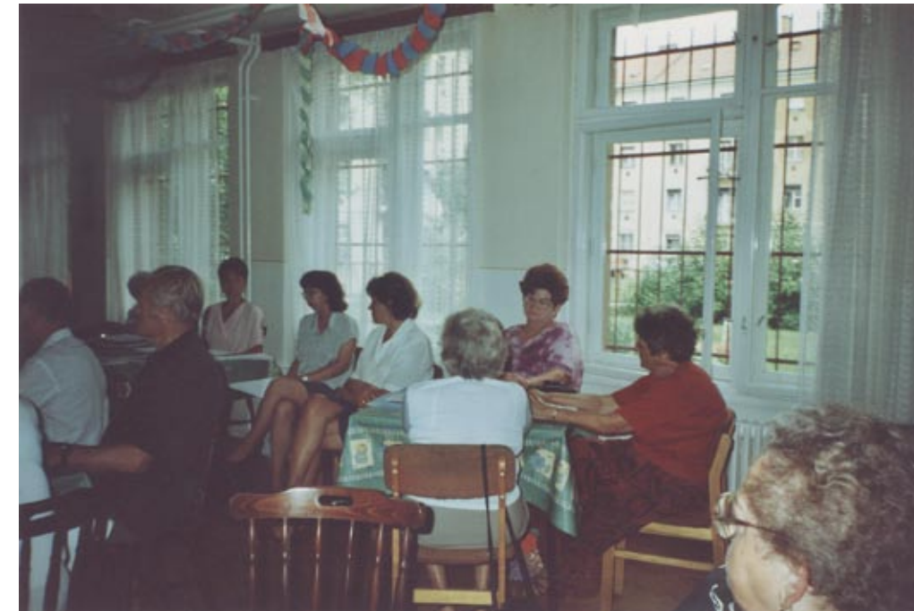
Klubfoglalkozás a 13. számú Gondozási Központban, 1995