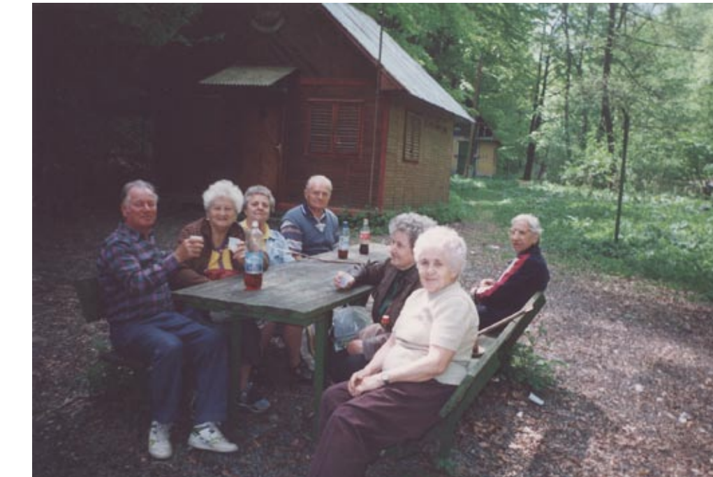
Kirándulás Garadnán, 2004. augusztus 19.