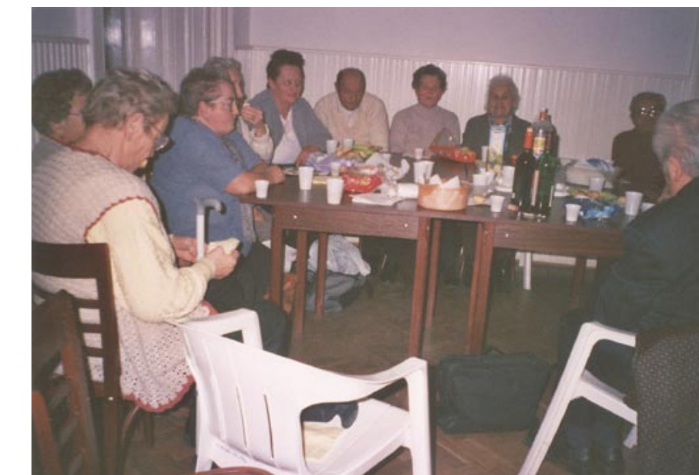
2003. év végi összejevetel a vasgyári Községi Házban