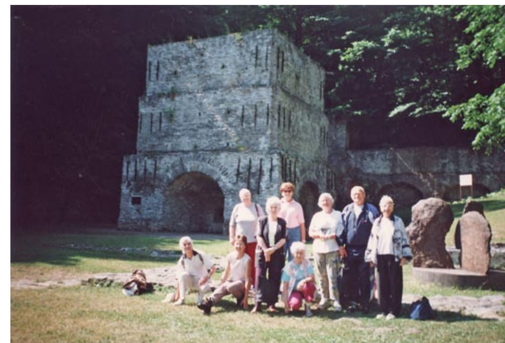
Kirándulás az őskohónál, 2004. augusztus 19.