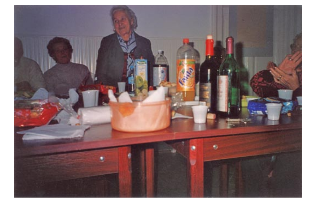
2006. év végi összejevetel a vasgyári Községi Házban