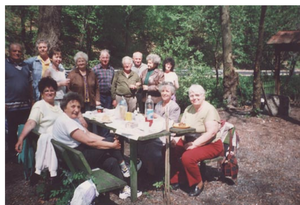
Kirándulás Garadnán, 2004. augusztus 19.