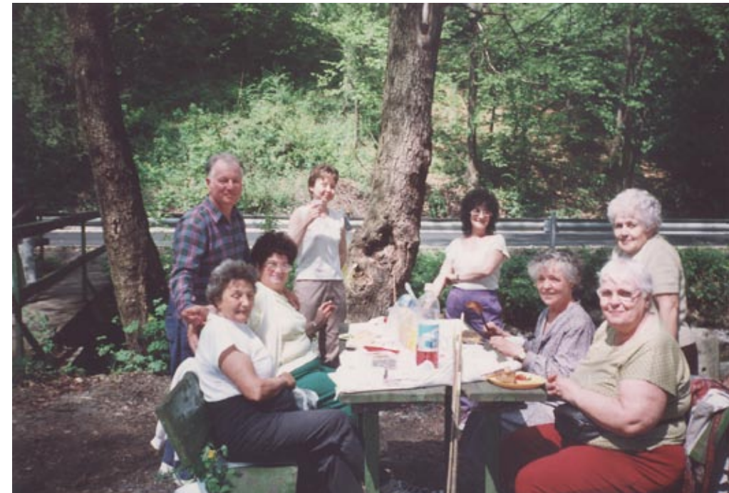
Kirándulás Garadnán, 2004. augusztus 19.