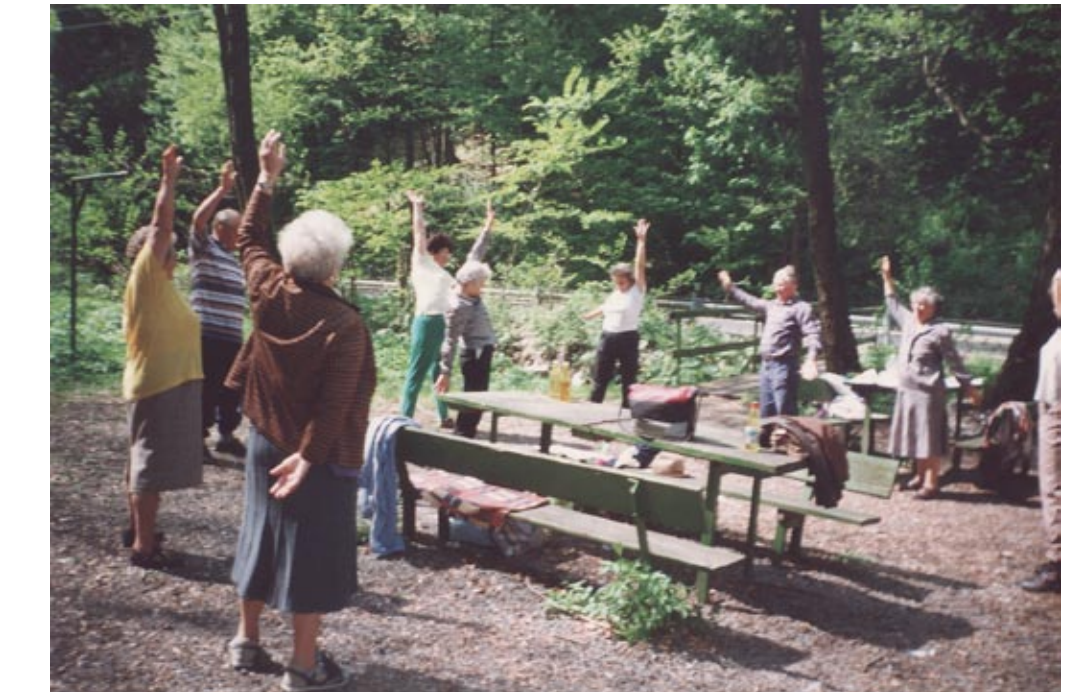
Torna a szabadban