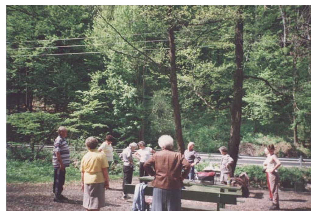
Torna a szabadban