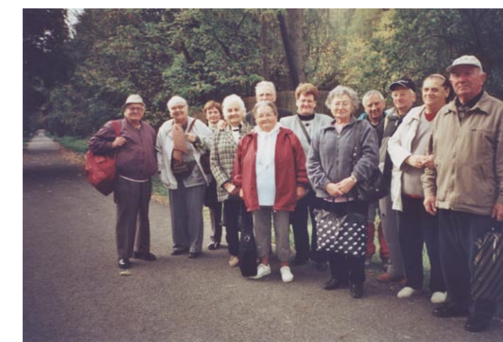
Kirándulás Lillafüreden 2007 nyarán