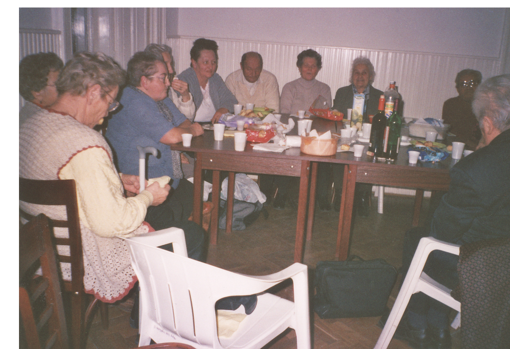
2003. év végi összejevetel a vasgyári Községi Házban