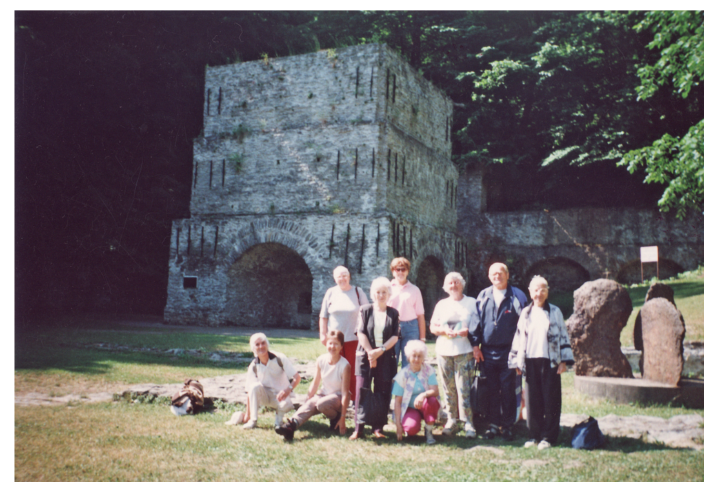
Kirándulás az őskohónál, 2004. augusztus 19.