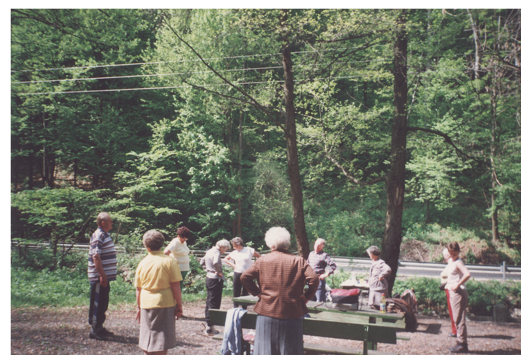
Torna a szabadban