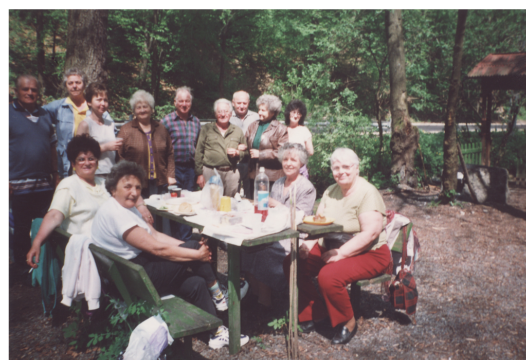
Kirándulás Garadnán, 2004. augusztus 19.