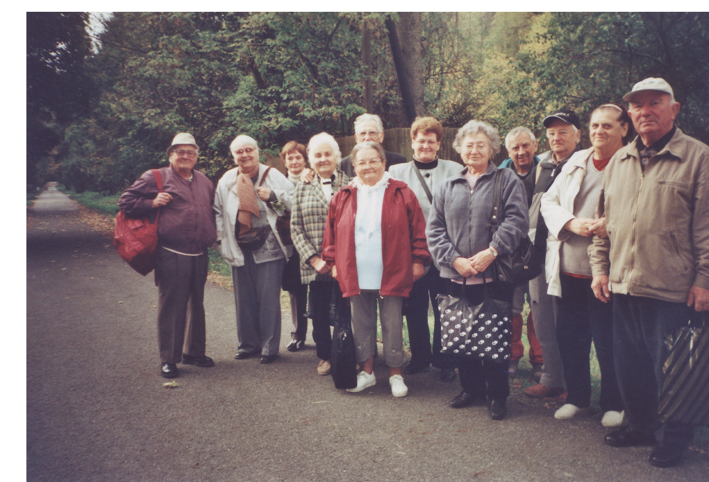
Kirándulás Lillafüreden 2007 nyarán