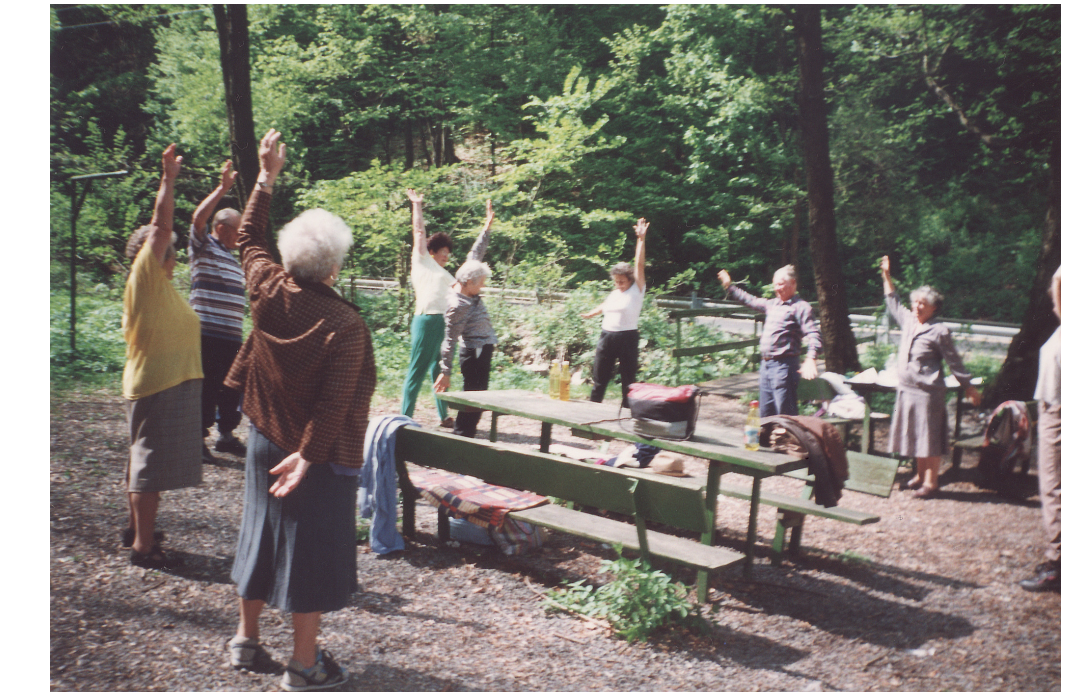
Torna a szabadban