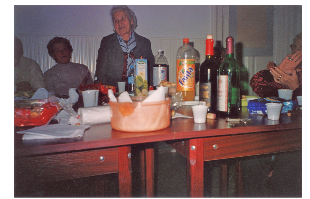
2006. év végi összejevetel a vasgyári Községi Házban