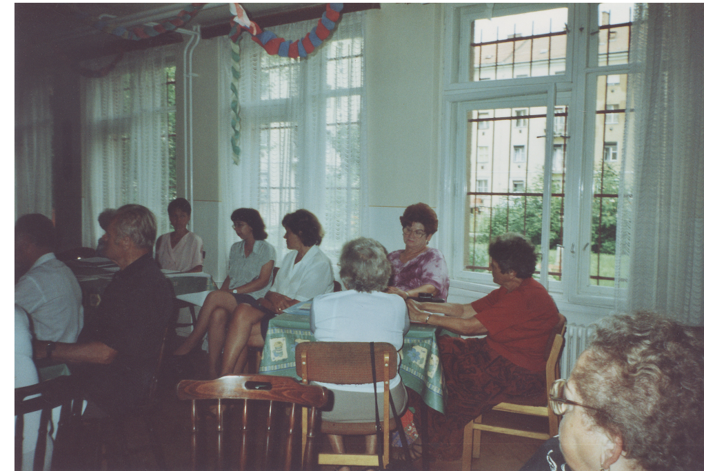
Klubfoglalkozás a 13. számú Gondozási Központban, 1995