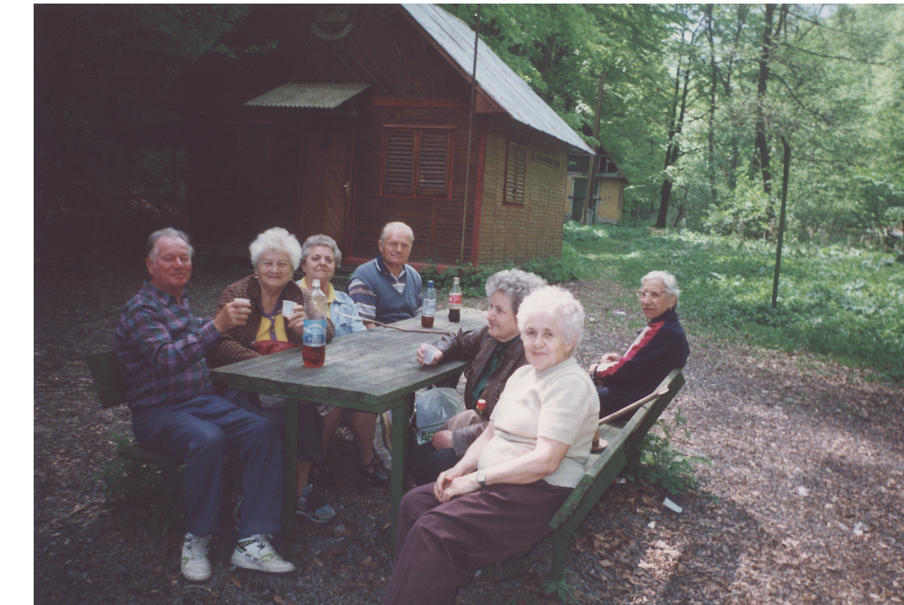
Kirándulás Garadnán, 2004. augusztus 19.