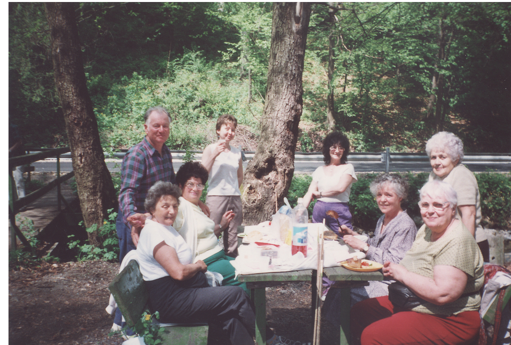
Kirándulás Garadnán, 2004. augusztus 19.